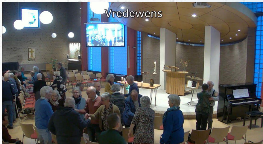
Terug- en vooruitblik, quiz en vesperviering in de kerkzaal.