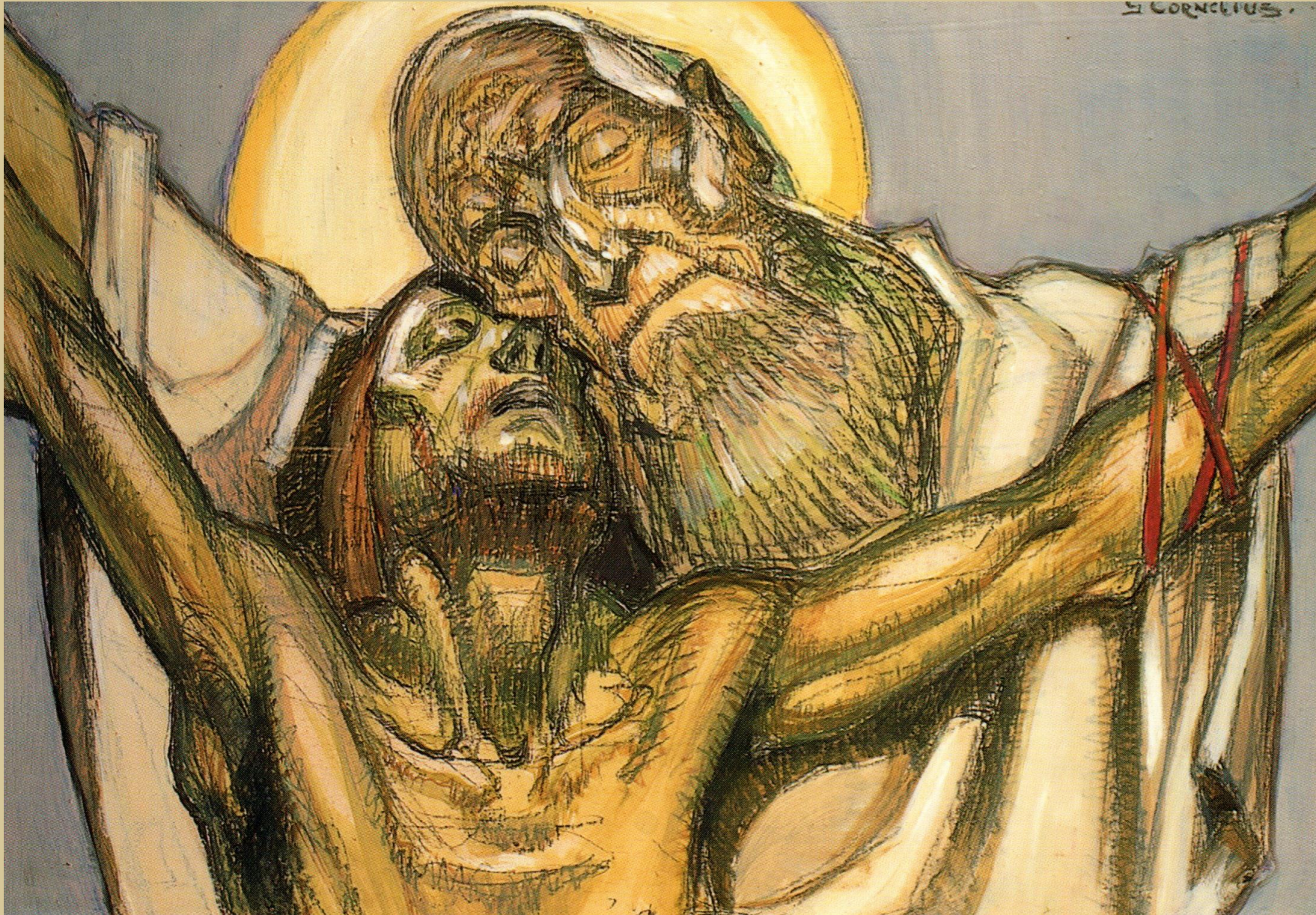
'De troostende Vader', Georges Cornelius