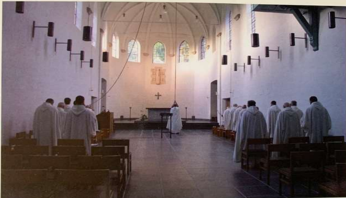
Meeleven met de gebedstijden in een klooster