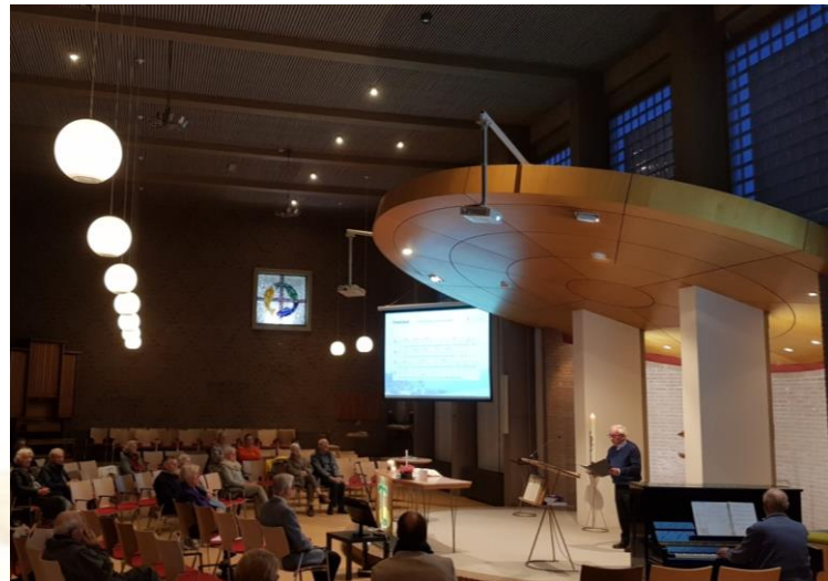
Een moment uit de laatste Oase-viering met rechts achter de piano Paul van der Steen die cantor Huub Bukkems begeleidt.