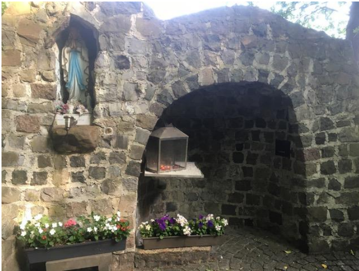
Mariagrot op Heers in Veldhoven