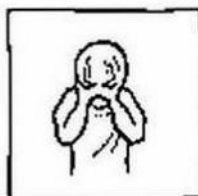
maar verlos ons van het kwade