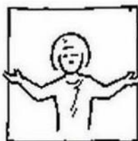
uw rijk kome