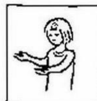
zoals ook wij vergeven aan onze schuldenaren