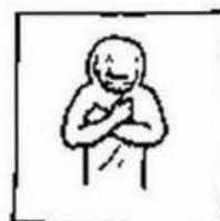
en vergeef ons onze schulden