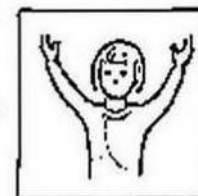
en de kracht en de eeuwigheid