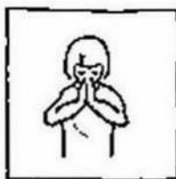
uw naam worde geheiligd