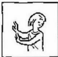
en breng ons niet in beproeving