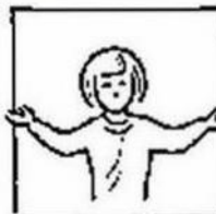
Want van u is het koninkrijk