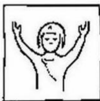
Onze Vader die in de hemel zijt