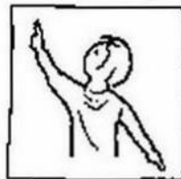
op aarde zoals in de hemel