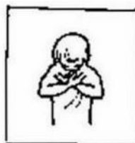
uw wil geschiede