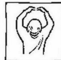
tot in eeuwigheid. Amen