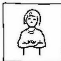
Geef ons heden ons dagelijks brood