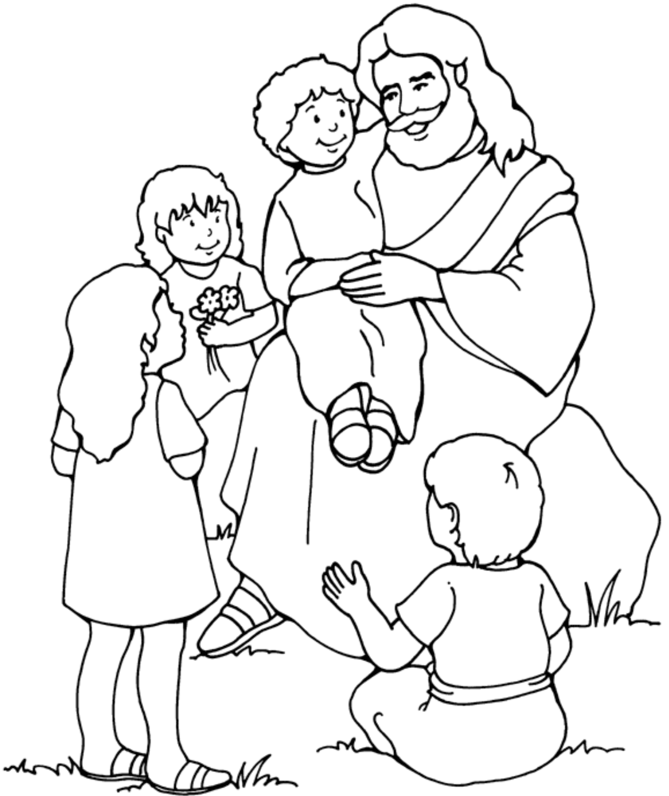
Kleurplaat van Jezus